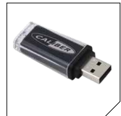
USB reader (USB not included)