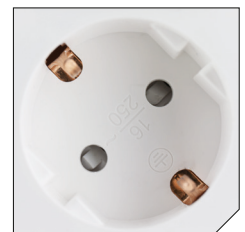
45° rotated AC sockets