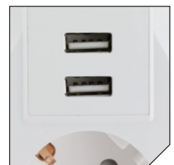
2 USB charge outputs, 5V 1A each