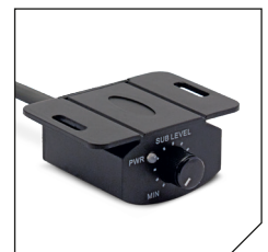
Remote control (wired)