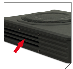
Passive radiators Built-in on both sides