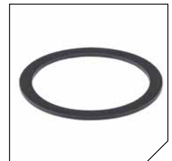
EVA sealing rings included