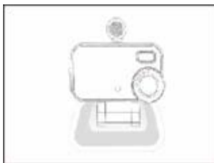
2. Put the device on the pad.