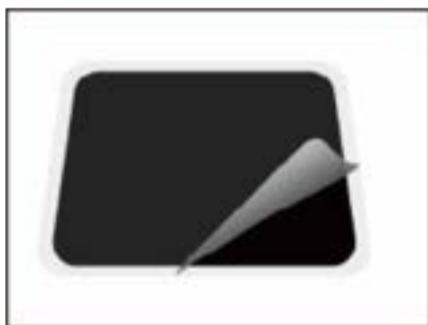
1. Tear the top protective film of nano-silicon pad.